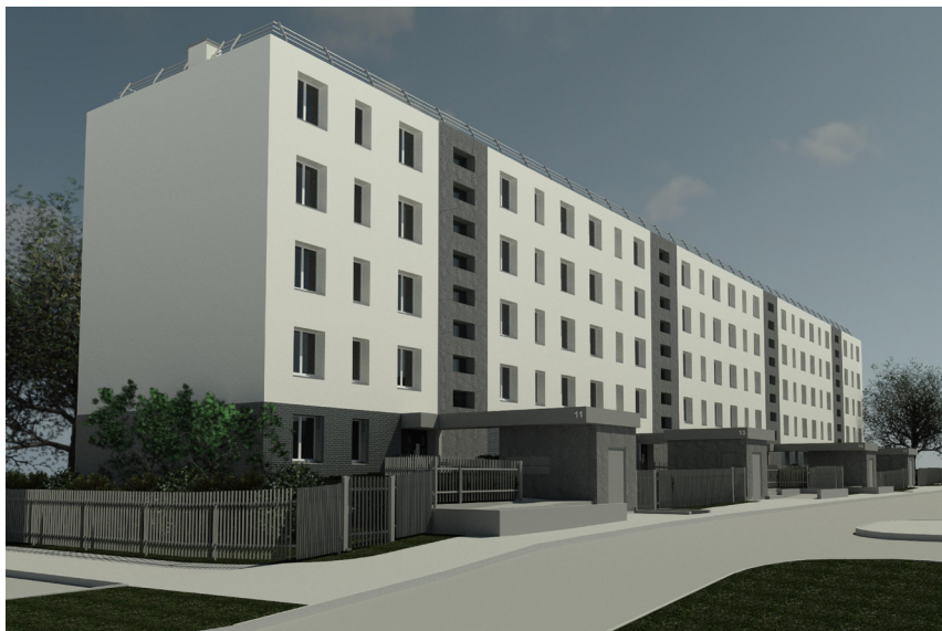
RÉHABILITATION DE LA " BARRE JAURÈS "