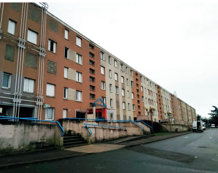
" LA BANANE " DISPARAÎT EN 2022

Le bâtiment emblématique « La Banane » est le premier immeuble dont les habitants ont été relogés, la « Barre Résistance » est le prochain immeuble, les relogements ont commencé. Il sera bientôt remplacé par la nouvelle école primaire de Mainvilliers.